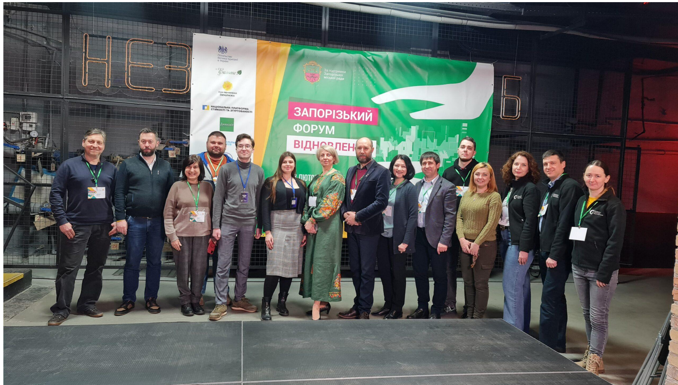
Запорізький форум відновлення 2024

Рада відновлення ініціює співпрацю з місцевою і державною владою, бере участь у робочих групах і зустрічах органів місцевого самоврядування, готує для них рекомендації та проводить відкриті громадські обговорення, забезпечуючи партисипацію та демократичний процес планування при відновленні Запоріжжя та області.