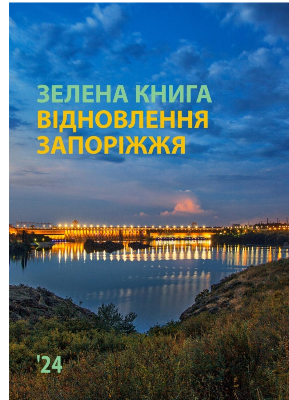
Дорожня карта раннього і післявоєнного відновлення: 18 експертів, 7 напрямків